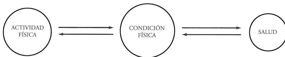
Figura 1. Paradigma centrado en la condición física

relaciones directas con la salud y hacia el que se dirigen las investigaciones y las estrategias de promoción.